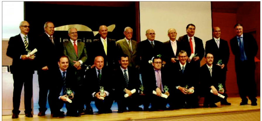
Premiados de la edición 2008 junto a los miembros del jurado

Está previsto que el jurado, compuesto por una selección de los patronos de la Fundación Valenciaport, se reúna y emita su fallo antes del 30 de septiembre de este año.