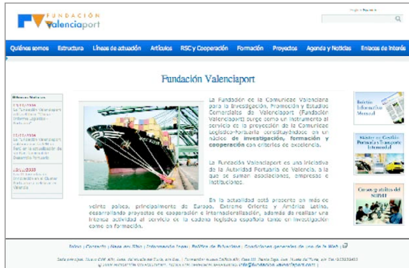
Captura de pantalla de la nueva Home

De este modo la Comunidad Logístico - Portuaria podrá consultar información