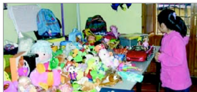
Imagen de algunos de los juguetes recogidos en la campaña 2008

En esta misma línea la Fundación Valenciaport llevó adelante otra iniciativa de carácter social obsequiando a su personal, durante las pasadas navidades una caja integrada por productos de comercio justo y productos ecológicos. Con el regalo de esta caja la Fundación Valenciaport pretende, por tercer año consecutivo, extender el conocimiento de prácticas de consumo responsable. Al adquirir estos productos se colabora con el desarrollo de los países más desfavorecidos, en la preservación del medio ambiente y en la promoción de condiciones laborales y comerciales dignas. En esta ocasión se colaboró con "Contraste", a través de la Fundación Novaterra.