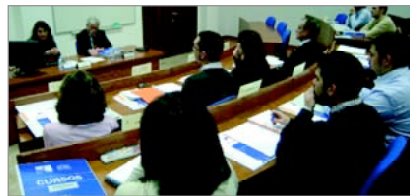
Imagen de la inauguración de la anterior edición del curso

Este programa está dirigido a responsables de departamento, responsables técnicos, directores de proyectos y organizadores de eventos, que dirijan, diseñen, formulen o gestionen proyectos relacionados con actividades de logística, transporte, puertos, tecnologías de la información, proyectos de innovación y desarrollo