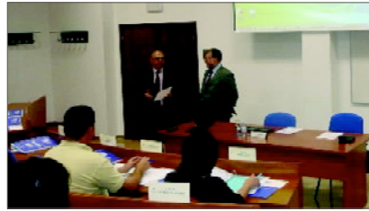
Imagen de la anterior edición del curso

Además de los contenidos básicos del curso como el inmovilizado y los activos