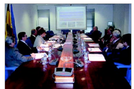
Imagen de la reunión del Patronato

de euros de presupuesto, en línea con el del año anterior. La mayor parte de dicha financiación proviene de la propia fundación mediante la generación de proyectos, tanto del Plan Nacional de I+D+i, como proyectos europeos (fundamentalmente del VII Programa Marco) y mediante actividades de formación, departamento que realizará en 2009 un especial esfuerzo en la internacionalización.