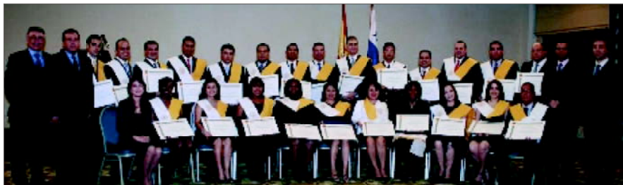
Titulados e invitados al acto de entrega de títulos de la 1ª ed. Internacional del Máster en Gestión Portuaria y Transporte Intermodal

La actual promoción, cuenta con un total de 27 alumnos procedentes en su mayoría del sector logístico-portuario (52%), una media de edad de 29 años y un perfil académico tanto técnico (23% Ingenierías) como de otras carreras universitarias tales como, Económicas, ADE, Marketing, Derecho o Comercio Internacional (77%), entre otras. Es de destacar la participación internacional en esta edición, que cuenta con 8 alumnos procedentes de América Latina y 2 alumnos de China.